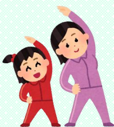
早寝・早起き・朝ごはん体操