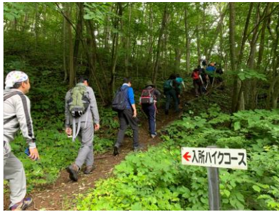
御駒山ハイキング