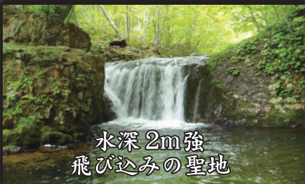
水深 2m 強 飛び込みの聖地