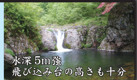
水深 5m 強 飛び込み台の高さも十分

【遡行時の注意点】 滝の周辺は白く泡立ち、絶対に近づかないこと。強く引っ張られることもある