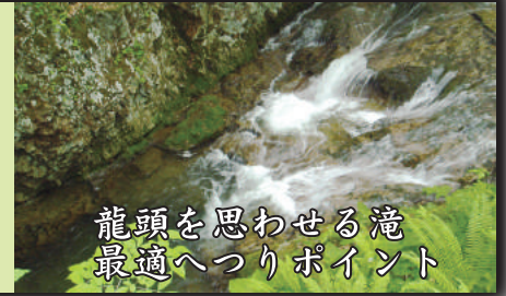
龍頭を思わせる滝 最適へつりポイント

【遡行時の注意点】 なめ滝から迂回路を使用すると上部にある龍頭の滝・龍流の滝を通過してしまう。