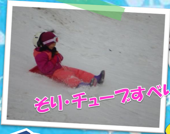
そり・チューブすべり