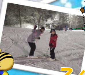
スノーシューハイキング