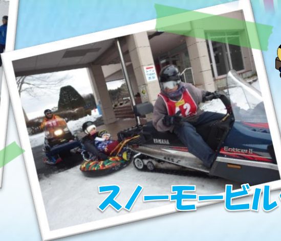
スノーモービル体験