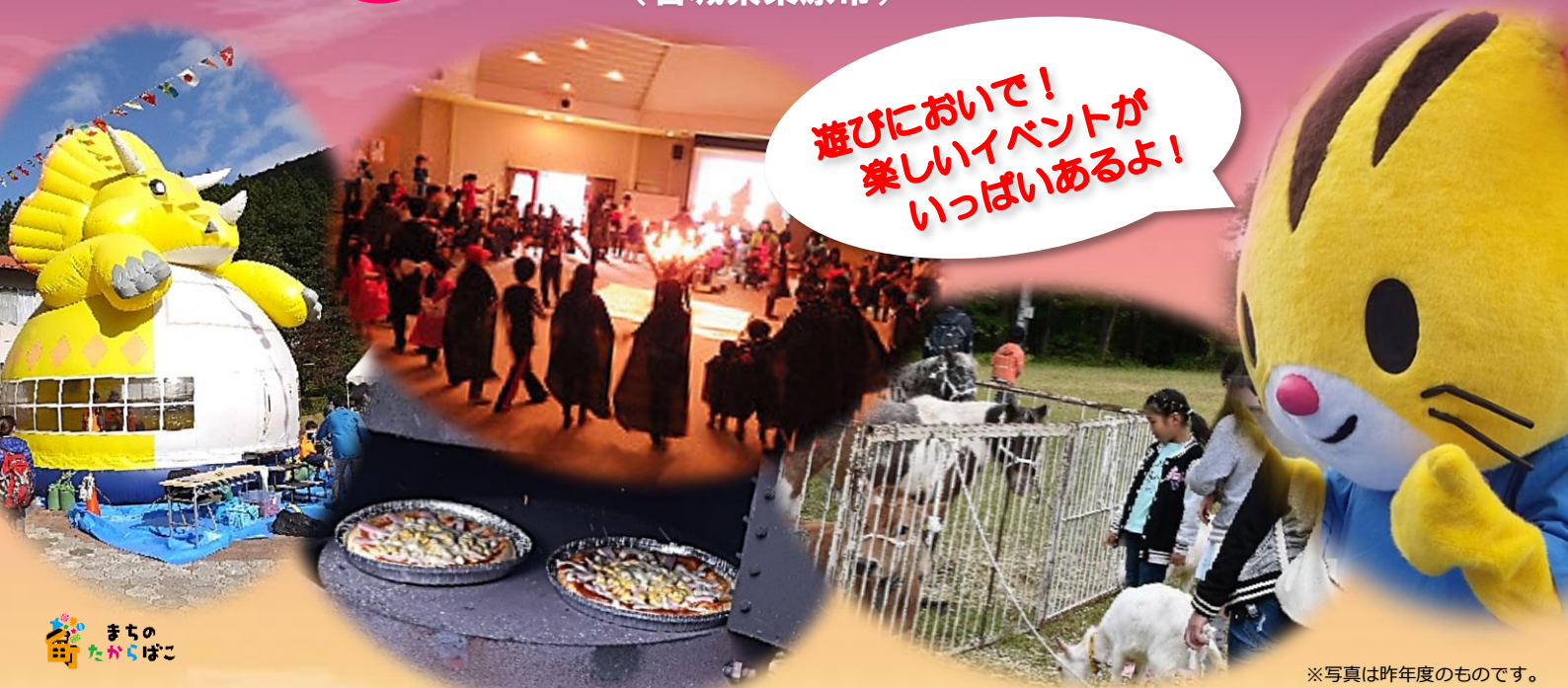
※写真は昨年度のものです。