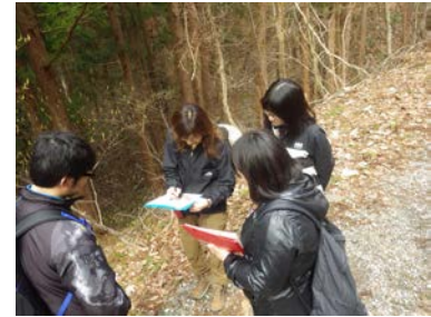
【グリーンウォッチング】