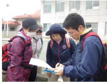
【オリエンテーリング】