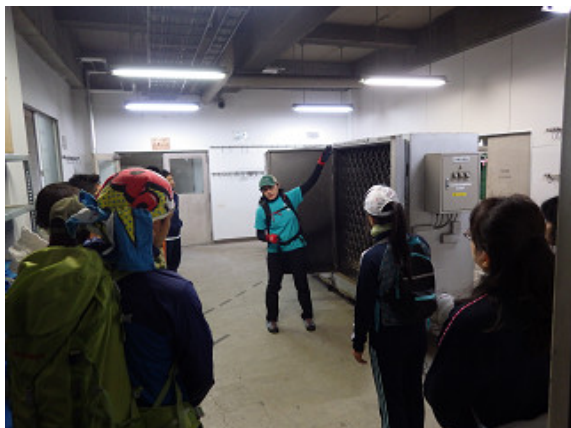
当日の動線を確認