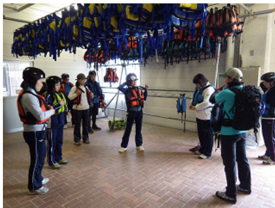
物品の使い方等の説明