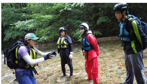
実際のコースで説明